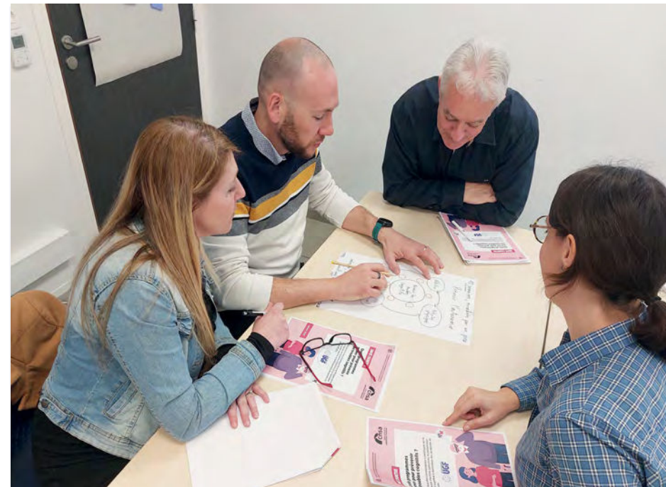
Formation «Animer des séances collectives» à l'attention d'acteurs du Lot-et-Garonne